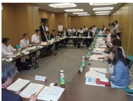
第1回検討会の様子